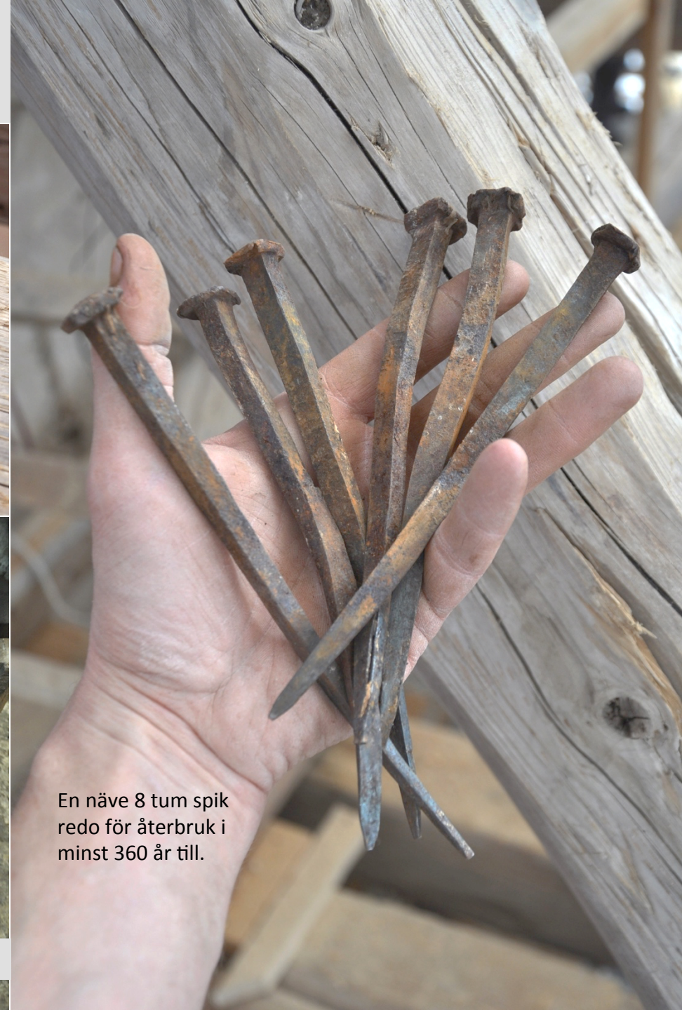
En näve 8 tum spik redo för återbruk i minst 360 år till.