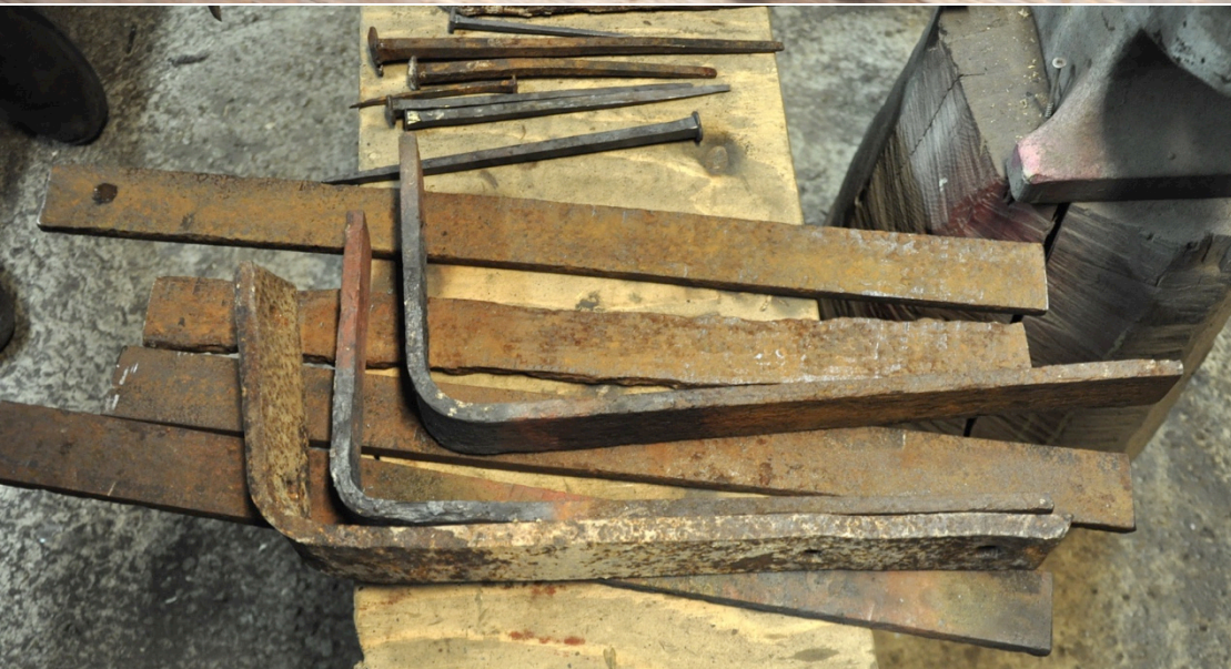
Järn för listverkets upphängning nyttillverkades av äldre lancashirejärn.