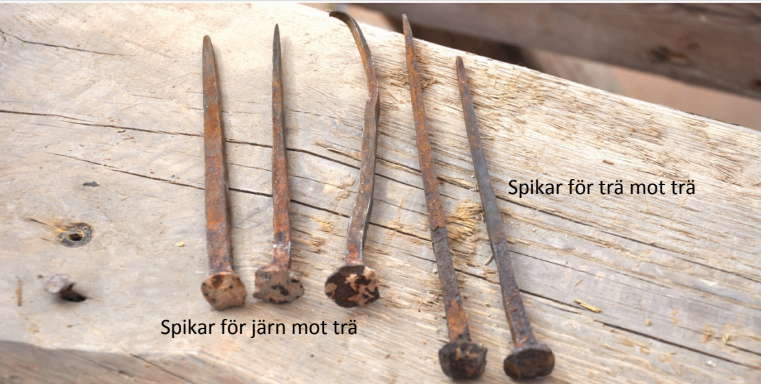
Spikar för järn mot trä

Smidda spikar troligen från Arboga spiksmedja. Väldigt många av slottets större originalspik har återbrukats för samma ändamål som de tidigare haft. De flesta var spikade i färska sparrar som torkat och fått stora torrsprickor där spiken suttit. Därför gick det att få ut dem hela.